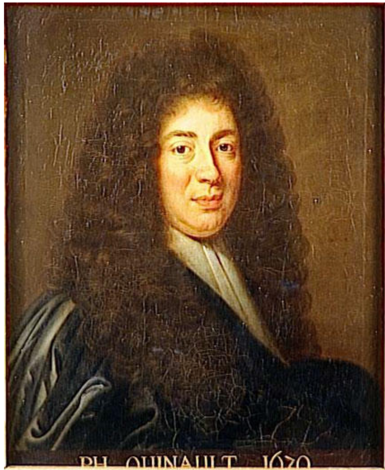
QUINAULT, Philippe 1676