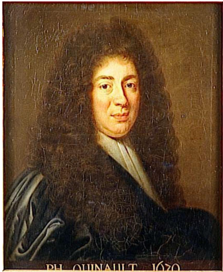
QUINAULT, Philippe 1671