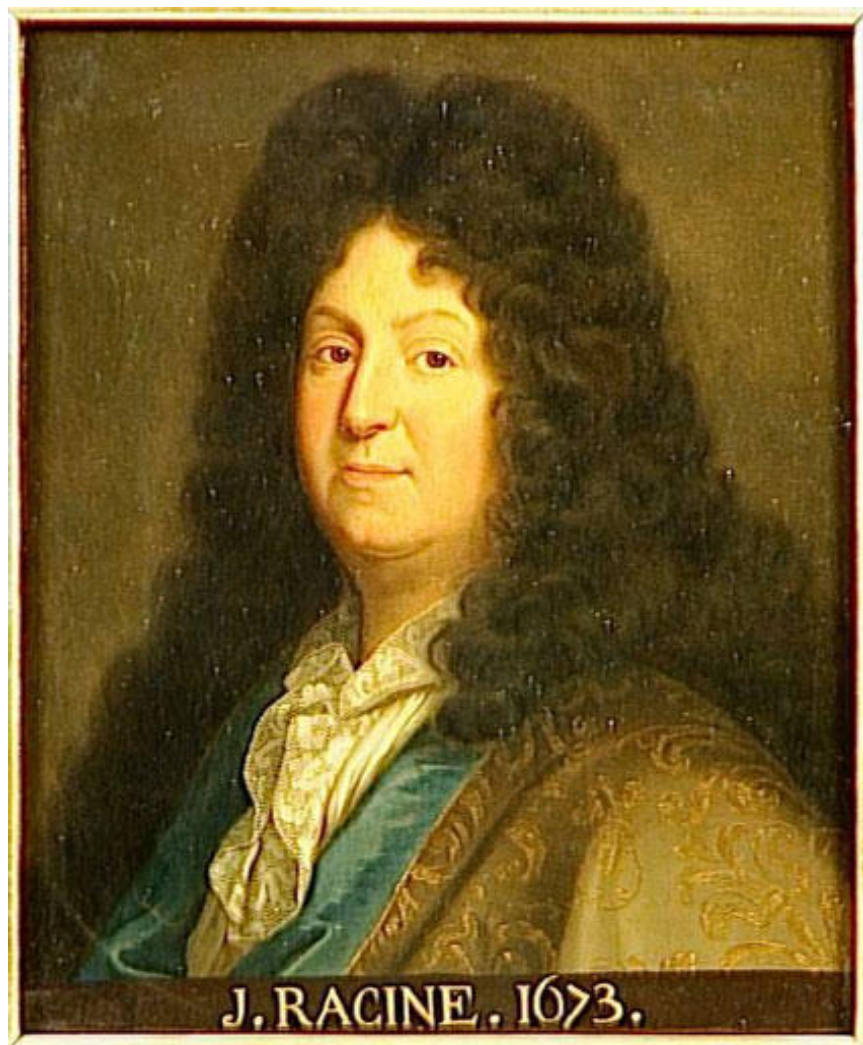
RACINE, Jean 1674

Publié par Ernest et Paul Fièvre, Juin 2011