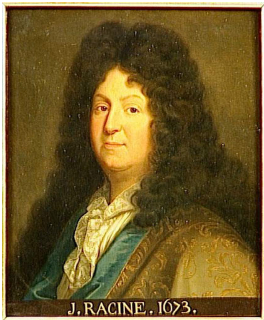
RACINE, Jean 1673