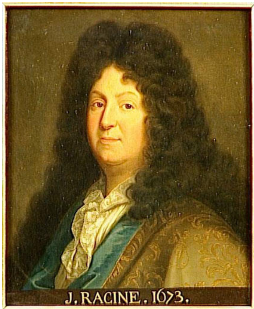
RACINE, Jean 1677