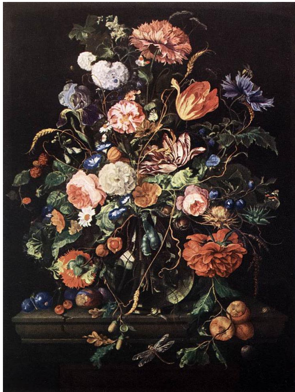
SAINT-AIGNAN, Etienne 1793